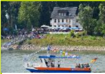
Monheim am Rhein